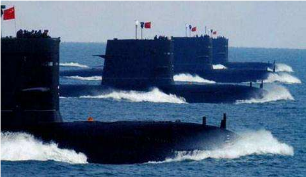
Tàu ngầm lớp Tổng loại cải tiến trang thiết bị mới của Hải quân Trung Quốc.