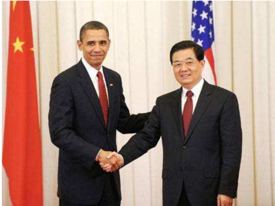
Tổng thống Mỹ Barack Obama và Chủ tịch Trung Quốc Hồ Cẩm Đào cam kết thúc đẩy hợp tác song phương và đa phương

Chẳng nghi ngờ gì là phe hiếu chiến ở Trung Quốc gồm các sĩ quan PLA và các nhóm thể lực chính trị khác đều hầu hết nhắm về phía Mỹ, coi đó là một yếu tố kìm hãm nhất chống lại sự trỗi dậy của Trung Quốc. Sau cùng thì mục đích để Trung Quốc phát triển Hải quân Đại dương được trang bị các tàu ngầm nguyên tử và hàng không mẫu hạm chính là nhằm phá vỡ "chính sách kìm hãm chống lại Trung Quốc" giả định là do Washington cầm đầu. Lập luận trên cho rằng bằng cách tạo đồng minh với các nước chủ nhà như Nhật Bản, Nam Hàn, Philippines và đại loại thế – và bằng cách đồn trú các cứ điểm hải quân trên các đảo từ Hawaii dài xuống Okinawa, Guam và xa hơn nữa – Mỹ muốn kiềm chế và bao vây Trung Quốc thông qua một "chuỗi đảo"[19]. Như Đô đốc Mike Mullen, Chủ tịch Liên Tham mưu trưởng của Mỹ, đúc kết trong tháng 5 là PLA đang phát triển các khả năng "tập trung vào hải và không quân... Dường như họ rất chú ý đến Hải quân Mỹ và các căn cứ của chúng ta tại các vùng trên"[20].