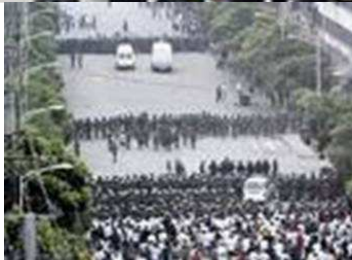
Bạo động ở Tân Cương

Như triết gia người Phổ Carl Von Clausewitz đã đưa ra, "chiến tranh là một dạng mở rộng của đời sống chính trị trong nước". Điều này có thể ứng với sự tương quan mật thiết giữa một bên là chính sách đối ngoại của quốc gia và sự triển khai sức mạnh ra toàn cầu, và một bên là đời sống chính trị trong nước đó. Cho rằng một phần lớn nền kinh tế Trung Quốc vẫn còn bị khống chế bởi những công cụ của đảng cầm quyền – bao gồm khoảng 150 công ty quốc doanh độc quyền trong nhiều lĩnh vực từ dầu hỏa và thép đến ngân hàng và thông tin liên lạc – có thể nào Bắc Kinh thuyết phục được thế giới rằng Trung Quốc là một "nền kinh tế thị trường hoàn chỉnh"? [67] Thêm nữa là với vô số những vấn đề trong định chế chính trị tại Trung Quốc, đặc biệt là tính đàn áp không mệt mỏi hầu hết các dạng tự do và quyền con người đã được công nhận qua các hiệp định thỏa đáng của Liên hiệp quốc, có thể nào Bắc Kinh lập luận thuyết phục được là sự "đồng thuận Bắc Kinh" là ưu việt hơn so "mô hình phương Tây"[68]. Hơn nữa, giới lãnh đạo chớp bu bao gồm Chủ tịch Hồ và Chủ tịch Quốc hội Nhân dân Ngô Bang Quốc (Wu Bangguo), đều là thành viên cao cấp trong Bộ Chính trị, đã lặp đi lặp lại là Trung Quốc sẽ "không bao giờ