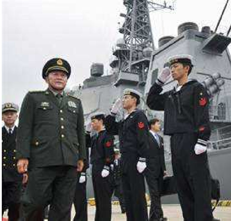
Tư lệnh Hải quân Trung Quốc Trương Ngô Thăng Lợi

Hồ Cẩm Đào, cũng là Chủ tịch Quân ủy Trung ương (CMC), tương đương Tổng tư lệnh, vừa có những sửa đổi quan trọng đến chính sách ngoại giao và an ninh của các bậc tiền nhiệm. Đặng Tiểu Bình, tiền bối gần đây nhất, đã vạch ra một chuỗi những cương lĩnh trong cuối thập niên 1980 và đầu thập niên 1990 như sau: Trong chính sách ngoại giao, "đóng vai trò khiêm tốn và đừng bao giờ dẫn đầu"; và nói về Mỹ là "tránh đối đầu và tìm cơ hội hợp tác" [6] . Chủ tịch trước đây là Giang Trạch Dân từ giữa thập kỷ 1990 đã tiên phong trong cái gọi là "chính sách ngoại giao cường quốc trong tình hình toàn cầu có một siêu cường và vài ba cường quốc". Điều này có nghĩa là Trung Quốc phải hợp tác với các cường quốc khác như Nga, Nhật và liên minh Châu Âu để chuyển cái "trật tự thế giới đơn cực" – cái đang bị Mỹ thống trị – thành ra một "trật tự thế giới đa cực". Tuy nhiên, Trung Quốc tránh né trực tiếp xung đột với siêu cường đơn độc này, và mối quan hệ giữa lãnh tụ Giang và chính phủ Bill Clinton là từ đó mà ra và rất ổn định [7] . Cùng lúc, họ Giang cố gắng thuyết phục các nước láng giềng Trung Quốc là Bắc Kinh luôn bám sát chiến lược "trỗi dậy trong hòa bình", có nghĩa là sự vươn lên của "Vương quốc Trung nguyên" sẽ không là mối đe dọa cho họ. Tuy nhiên, từ "trỗi dậy trong hòa bình" ít khi được sử dụng bởi các nhà ngoại giao Trung Quốc và các cán bộ cao cấp từ đầu thập niên 2000 [8] .